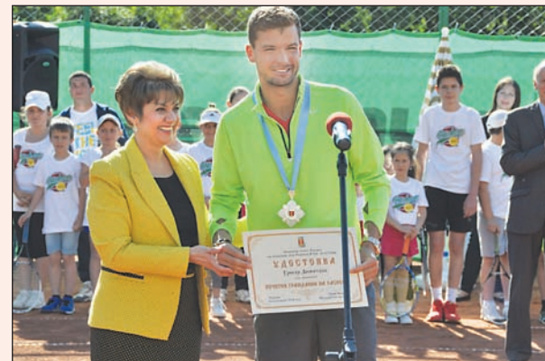
Григор Димитров - почетен гражданин на Хасково

Общинският съвет понижи някои от местните налози, като например тези за мотоциклетите и малките и по-стари коли. Това се случи на едно от първите заседания от мандата ни. Освен това намалихме и таксите за детски градини.