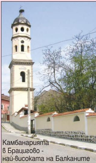
Камбанарията в Брацигово - най-високата на Балканите

- От началото на мандата съм член на Контролния съвет към НАПОС и за мен, като начинаещ председател на Общински съвет, е изключително полезно всяко едно заседание на УС и КС на Асоциацията. Директната обмяна на добри практики и контактите с колегите е изключително ценна. Провежданите от НАПОС семинари, дискусии и други форми на обучение са много полезни за всички общински съветници и особено за служителите в звената по чл.