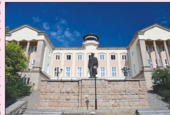
НЧ "Васил Петлешков-1847" - Брацигово