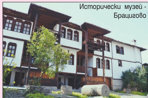
Исторически музей - Брацигово

29а от ЗМСМА. Организираните пътуващи семинари също са мощно средство за осъществяване на контакти и взаимодействия със сродни организации в други страни и по този начин за популяризиране на водещия опит и усъвършенстване на местното самоуправление.