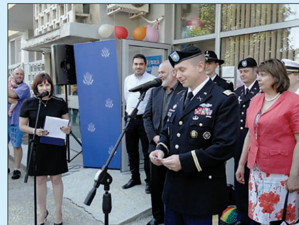
Реновиране на Детска млечна кухня - Силистра с финансовата подкрепа на военните сили на САЩ

- Първи мандат съм в Управителния съвет на Асоциацията и очакванията, както моите, така и на общинските съвети, са да работим за разрешаване проблемите на всички общински съвети, а те не са малко.