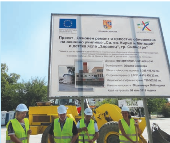
Проект "Основен ремонт и цялостно обновяване на ОУ "Св. св. Кирил и Методий" и на Детска ясла "Здравец" - гр. Силистра"

Силистра", на обща стойност около 2 265 000 лв. Проектът включва ремонт на пл. "Албена", реорганизация на кръстовище, изграждане на кътове за отдих, детска площадка и достъпна среда за хора с увреждания.