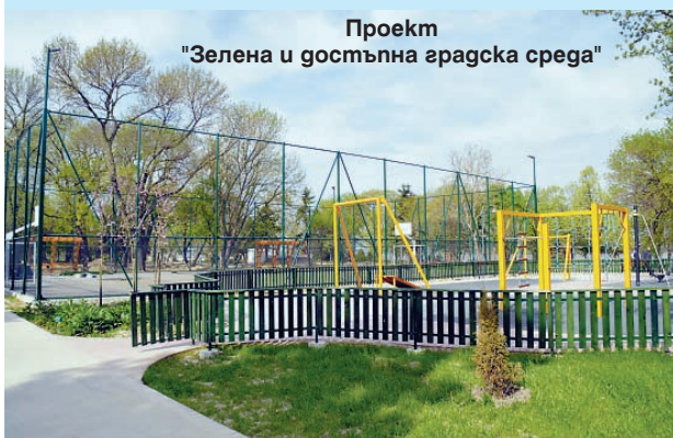
Проект "Зелена и достъпна градска среда"

* Проект "Реконструкция и рехабилитация на пл. "Албена" - гр.