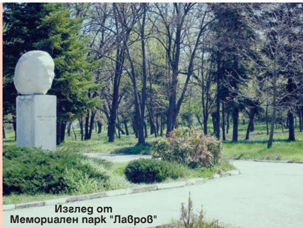
Изглед от Мемориален парк "Лавров"

По Оперативна програма "Административен капацитет" (ОПАК) 2007-2013 г. беше реализиран Проект за обучение на служители от цялата община, с цел подобряване качеството на предоставяните услуги на гражданите и бизнеса.