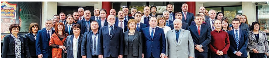
Общински съветници, кметове и кметски заместници - мандат 2015-2019 г.