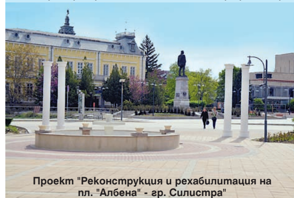
Проект "Реконструкция и рехабилитация на пл. "Албена" - гр. Силистра"

* Проект "Помощ за изготвяне на стратегия за МИРГ на Община Силистра" на обща стойност 46 257 лв. Предвижда се създаването на МИРГ и разработването на Стратегия за