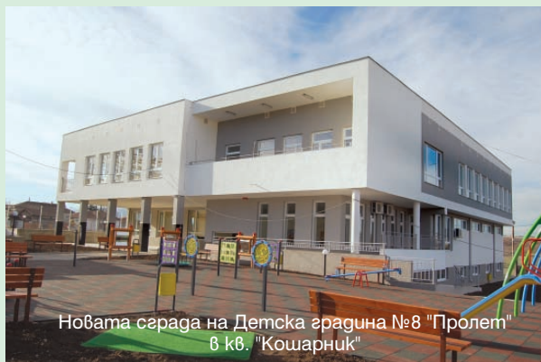
Новата сграда на Детска градина №8 "Пролет" в кв. "Кошарник"

Общината изпълнява и социални проекти, насочени към лица в неравностойно положение и маргинализирани общности. Ще спомена само един от тях. По проект "Комплексен подход за ромско включване в Община Монтана", осъществяван с подкрепата