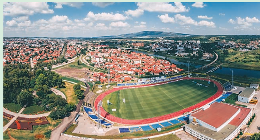
Реконструиранят градски стадион "Огоста"

Това е причина сесиите да преминават делово и гладко. Пос-