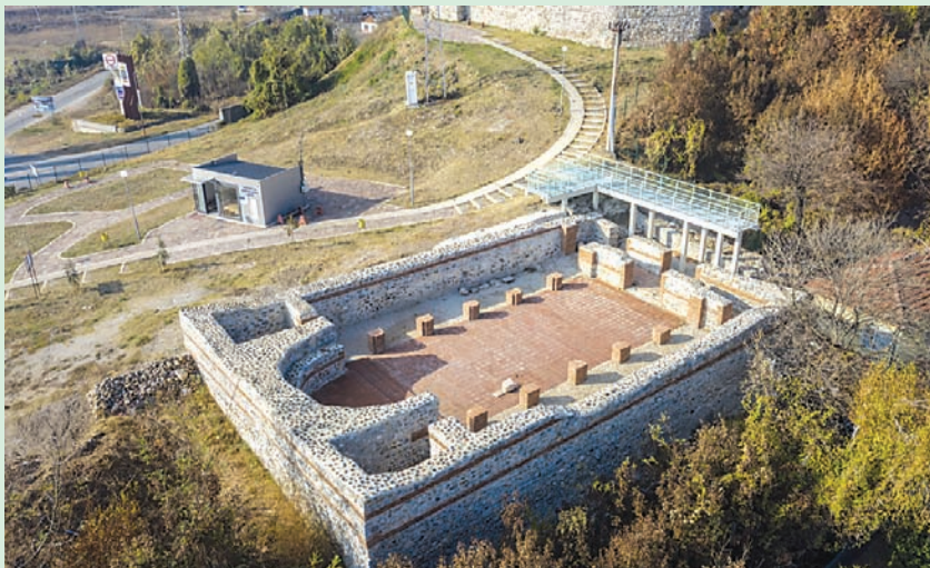
Реновираната антична крепост "Кастра ад Монтанезиум" на хълма "Калето"

на Българо-швейцарската програма за сътрудничество бе построена нова сграда на Детска градина №8 "Пролет" в най-големия ромски квартал в Монтана "Кошарник", както и Здравно-консултативни центрове там и в село Габровница.