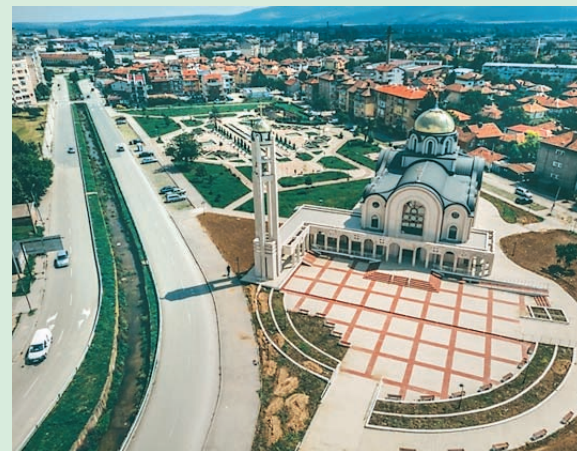
Новопостроеният православен храм "Св. Дух" в гр. Монтана

Асоциацията е създадена преди 15 години. Тя вече е укрепнала, утвърдила се е и е доказала своята полза за всички.