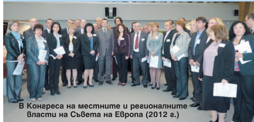
В Конгреса на местните и регионалните власти на Съвета на Европа (2012 г.)

7. Заключителна дискусия "Мандат 2011-2015 г. - успешен за издигане ролята на общинските съвети в местното самоуправление в Република България" - 03-04.09.2015 г., Ахелой.