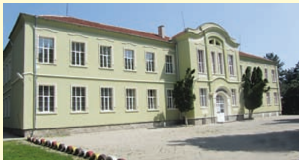
Средно училище "Неофит Рилски"

- Членувам в НАПОС от 2011 г., а от 2015 г. съм член на нейния Управителен съвет. Асоциацията ми дава възможност за обмяна на опит и добри практики, създаване на контакти, сближаване и единоумислие с председателите на общинските съвети в Република България. Моята препоръка за бъдещата дейност на Асоциацията е да продължава да работи в интерес на общинските съвети чрез организиране на семинари и обучения на председателите и общинските съветници, както и на служителите в звеното по чл. 29 а от ЗМСМА.