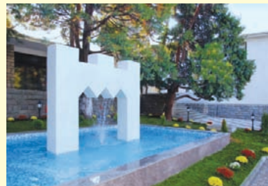
Обновеният градски площад в Долна баня