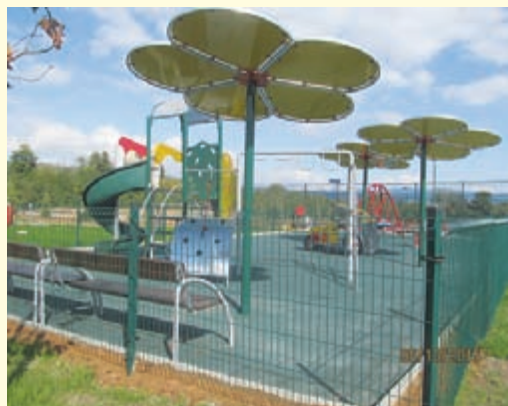
Детска площадка в Спортен комплекс - Долна баня

ката администрация, се определя политиката за изграждането и развитието на община Долна баня. Двата органа на местното самоуправление работят при непрекъснат диалог за решаване проблемите на местната общност и в посока привличане на повече инвеститори, за да подобряваме средата, в която живеят хората от общината.