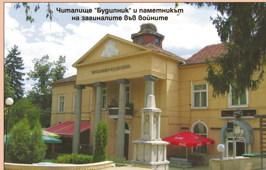
Читалище "Будилник" и паметникът на загиналите във войните

- През миналия мандат успяхме да реализираме успешно над 55 проекта. В момента продължава работата по проекти, свързани с "Реконструкция и рехабилитация на улици и тротоари на територията на община Ракитово". Те се финансират по Програма за развитие на селските райони 2014-2020 г.