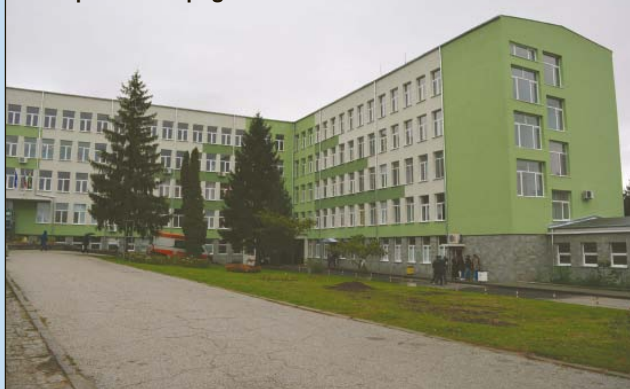
Санитарната сграда на МБАЛ - Павликени

Приветствам всяка инициатива за укрепване на местното самоуправление у нас и за повишаване на нашия капацитет.