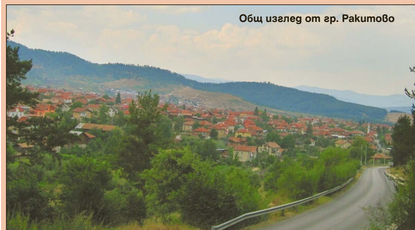
Общ изглед от гр. Ракутово

Общински съвет - Ракутово се състои от 17 общински съветници. През мандат 2019-2023 г. в него са представени 7 политически партии и коалиции: ПП "БЗНС" и Коалиция "Алтернативата на гражданите" - по 4 съветника, ПП ДПС - 3, БСП и ПП "Воля" - по 2-ма, ПП ГЕРБ и ПП "Нова алтернатива" - по 1.