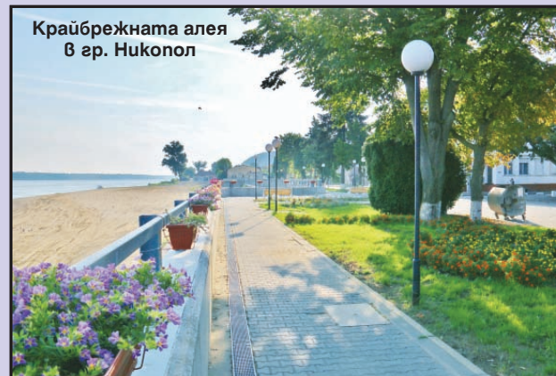
Крайбрежната алея в гр. Никопол

нат гр. Никопол в предпочитано място за туризъм. Град, съхранил вековното си историческо величие и красотата на река Дунав, град с неповторимо природно разположение, исторически гадености, ценности и традиции.