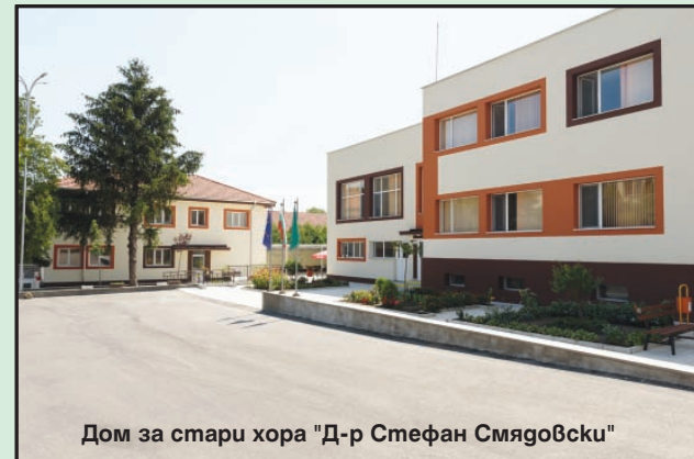
Дом за стари хора "Д-р Стефан Смяговски"

НАПОС консолидира гласа на общинските съветници от общините в България и дава възможност постиженията и проблемите на отделните