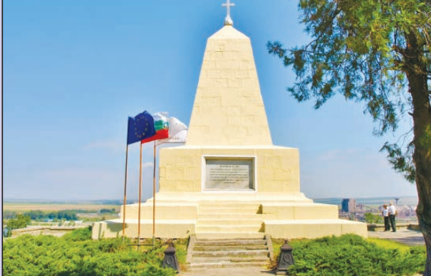
Паметникът на Победата от 1877-1878 г.

развита пълна инфраструктура, с висок риск от инциденти и недостатъчен капацитет. Общата цел на I-TeN е да подобри развитието на трансграничната транспортна система на третичните възли Turnu Magurele - Nikopol, а една