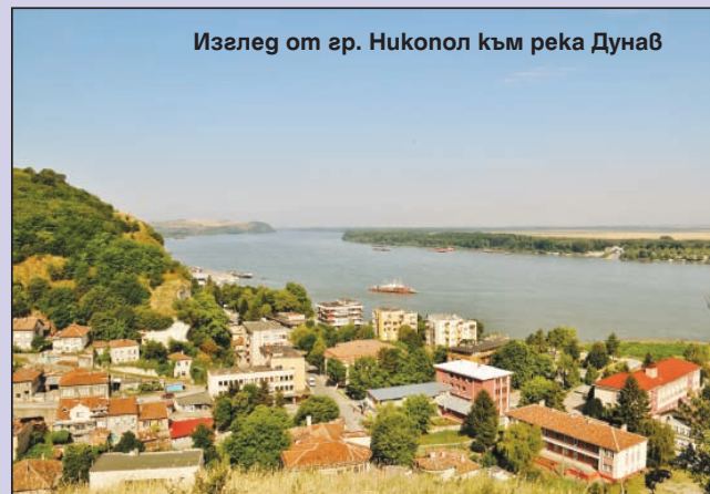
Изглед от гр. Никопол към река Дунав

● Проект "Мостове на времето: Интегриран подход за подобряване на устойчивото използване на трансграничното културно наследство в Никопол и Турну Мъгуреле" по Програма за трансгранично сътрудничество Interreg V-A Румъния - България 2014-2020 г., с бюджет приблизително 5,8 млн. евро. Проектът включва инвестиции в туристическа инфраструктура, интегрирани туристически продукти и услуги, ефективен маркетинг и повишаване осведомеността на населението, реализирани с активно участие на местните жители и заинтересовани страни. По този начин ще се създаде трайна икономическа изгода от трансграничното културно наследство и увеличаване на туристически посещения и нощувки.