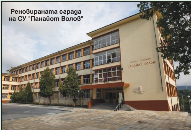
Реновираната сграда на СУ "Панайот Волов"

ровете допринасят за намиране на добрите решения и не са препятствие в изпълнение на намеренията и плановете за развитие на общината.