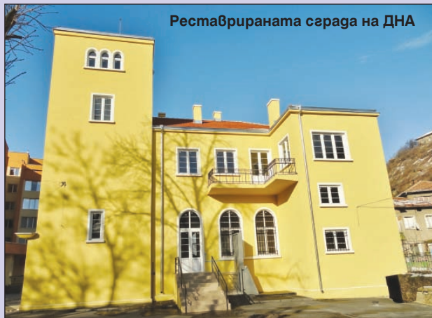
Реставрираната сграда на ДНА

развита пълна инфраструктура, с висок риск от инциденти и недостатъчен капацитет. Общата цел на I-TeN е да подобри развитието на трансграничната транспортна система на третичните възли Turnu Magurele - Nikopol, а една