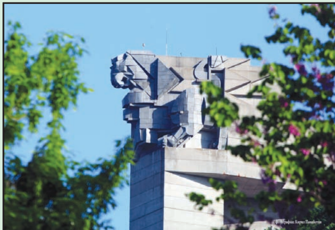
Паметник "Създатели на българската държава"

НАПОС дава и широки възможности за развитие на международните контакти на общината и установяване на връзки и сътрудничество с подходящи общини от други страни, в интерес на развитие на културния и туристически обмен, взаимноизгодното сътрудничество и др.