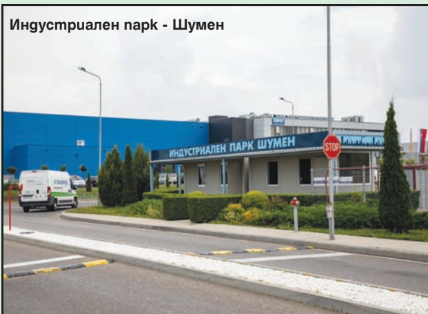
Индустриален парк - Шумен

● развитие на младежките дейности на територията на гр. Шумен и подпомагане реализацията на идеите на младите хора.