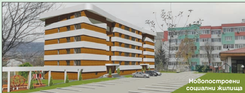
Новопостроени социални жилища

щници от РСУО. Над 7 млн. лева безвъзмездна европейска финансова помощ са вложени за благоустрояване и рехабилитация на градската среда в Шумен. Преди месец започна изпълнението на проект за строителство на нови социални жилища в кв. "Тракия" по ОП "Региони в растеж" за близо 3 млн. лв. Намерението на общината е да обнови и да увеличи жилищния си фонд, за да могат повече хора да се възползват от тази възможност.