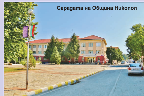
Сградата на Община Никопол